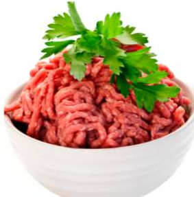
3 onces de bœuf 26g de protéines