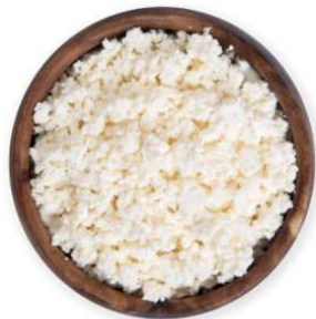
4 oz fromage cottage 14g de protéines