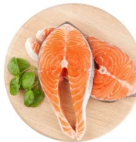
3 onces de poisson 22g de protéines