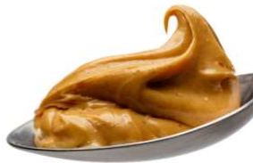
1 c à soupe de buerre de noix 7g de protéines