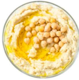
¼ tasse de Houmous 5g de protéines