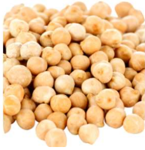
½ tasse de pois chiches 7g de protéines