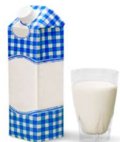
1c Lait de vache/ soja 8g de protéines