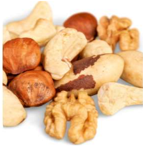
1oz Des Noix 5g de protéines