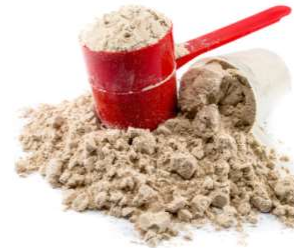
1 boule de poudre de protéine 25g de protéines