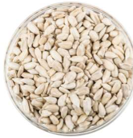
1oz Des Graines 6g de protéines