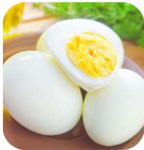
1 œuf 6g de protéines