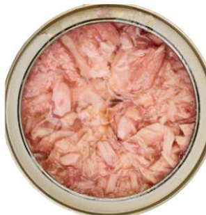
3 onces de thon 22g de protéines