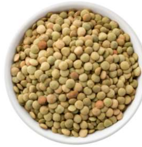
½ tasse lentilles 9g de protéines