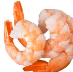
3 onces de fruits de mers 20g de protéines