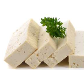
½ tasse de tofu 7g de protéines