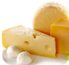
1 oz le fromage 7g de protéines