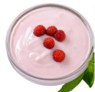
1 tasse de yogurt 1g de protéines