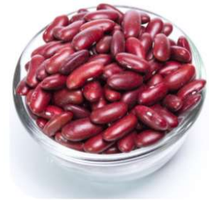
½ tasse Des Haricots 8g de protéines