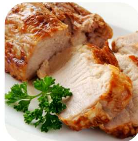
3 onces de porc 22g de protéines