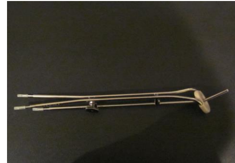
Applicateur pour le traitement